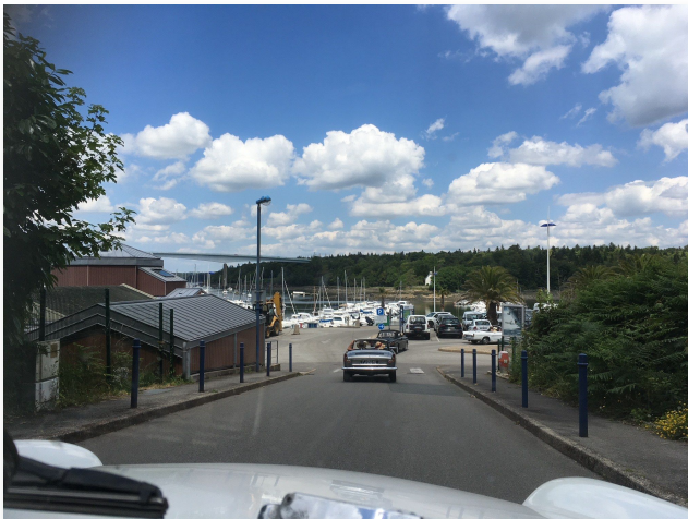
Embarquement pour notre croisière du jour