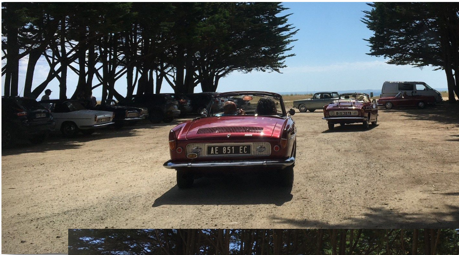
Un picnic bien mérité à l'Ile-Tudy avant le départ pour Bénodet