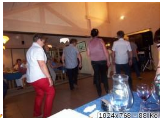
Avec bien évidemment le Madison, le rock et le twist

Mais il faut reprendre des forces car demain sera un autre jour. Alors " Au dodo "